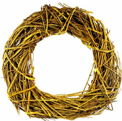
арт. 7709042 ZG14009B-1 Венок плетеный 28 см, цв. желтый