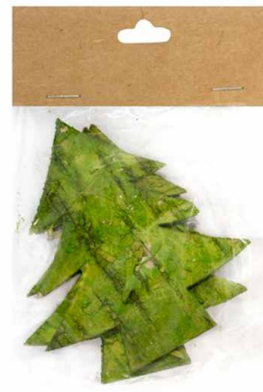
арт. 7709019 YW021 Декоративные элементы из коры дерева «Елочки» 10 см, 3 шт/уп