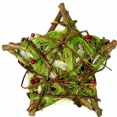
арт. 7709040 ZG14315C Декоративный элемент «Звезда» 24 см