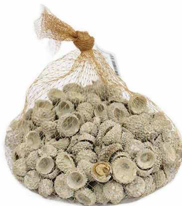
арт. 7708958 YW145 Декоративные элементы натуральные. Шляпки желудя цв. белый, 250 гр