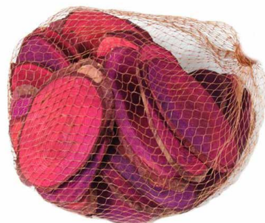
арт. 7708979 YW080 Спицы овалы для декора длина 5-9 см, толщина 0,4 см, 250 гр