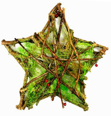
арт. 7709039 ZG14315B Декоративный элемент «Звезда» 33 см