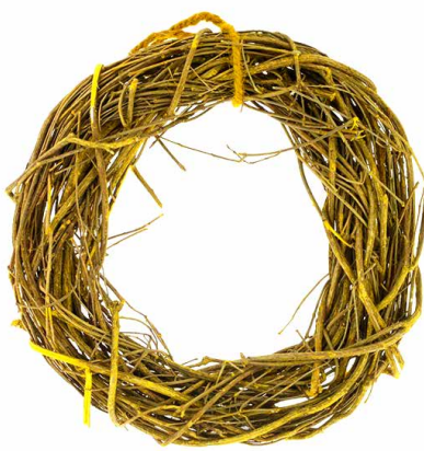
арт. 7709043 ZG14009C-1 Венок плетеный 24 см, цв. желтый