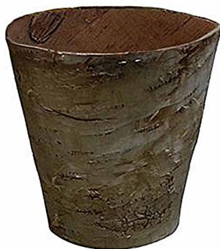
арт. 7709034 YW284B Горшочек из коры дерева 12×12×8 см