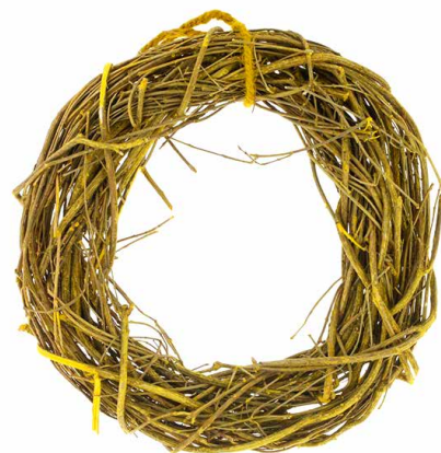
арт. 7709041 ZG14009A-1 Венок плетеный 33 см, цв. желтый