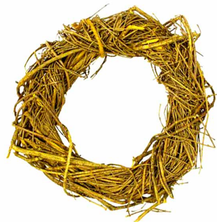
арт. 7709044 ZG14009D-1 Венок плетеный 18 см, цв. желтый