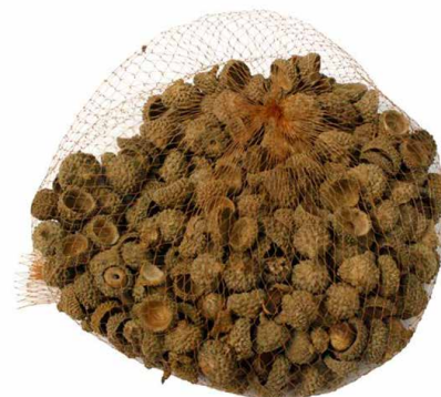
арт. 7709052 YW090 Декоративные элементы натуральные. Шляпки желудя, неокрашенные 250 гр