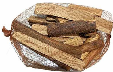
арт. 7708994 YW087-1 Поленья миниатюрные без коры (расколотые) длина 7-9 см, 250 гр