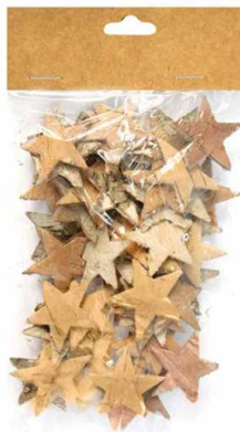
арт. 7709005 YW193 Декоративные элементы из коры дерева «Звездочки» 3 см, 50 шт/уп