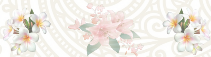
АВР-02 Набор для вышивания бисером Созвездие. «Весна» 25x50 см