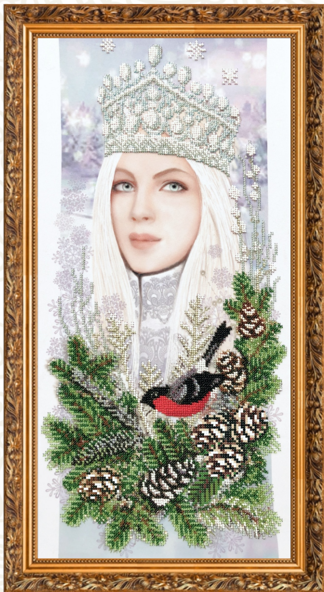
АВР-01 Набор для вышивания бисером Созвездие. «Зима» 25x50 см